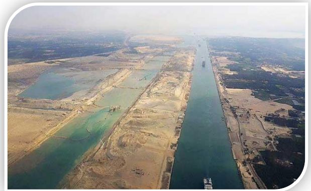
مشروع قناة السويس الجديدة

يجري حالياً إنشاء قناة جديدة موازية لقناة السويس وذلك بهدف تحقيق أكبر نسبة من الازدواجية لتسيير السفن في الاتجاهين بدون توقف في مناطق انتظار داخل القناة، وتقليل زمن عبور السفن المارة ليكون 11 ساعة بدلاً من 18 ساعة لقافلة الشمال، بالإضافة إلى تقليل زمن الانتظار للسفن ليكون 3 ساعات في أسوأ الظروف بدلاً من (8 إلى 11 ساعة) مما ينعكس على تقليل تكلفة الرحلة البحرية لملاك السفن، ويرفع من درجة تهمين قناة السويس، كما يزيد من قدرتها الاستيعابية لمرور السفن، ويرفع درجة الثقة في القناة كأفضل ممر ملاحى عالمي، كما يرفع أيضاً درجة الثقة في استعداد مصر لإنجاح مشروع التنمية بمنطقة قناة السويس، الذي تسهم عائداته في زيادة الدخل القومي المصري من العملة الصعبة مما يؤدي إلى زيادة عائد قناة السويس بنسبة 259% عام 2023 ليكون 13.2 مليار دولار مقارنة بالعائد الحالي 5.3 مليار دولار، وإتاحة أكبر عدد من فرص العمل للشباب المصري، وخلق مجتمعات عمرانية جديدة، ودفع عجلة الاقتصاد القومي