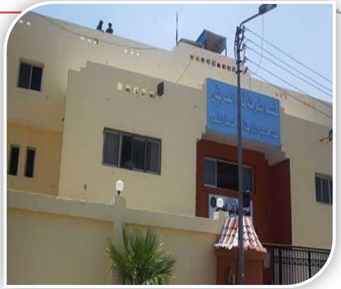
تطوير قسم شرطة ثان العريش

تستهدفها، كما تم دعم القوات بالمقومات اللازمة وتلبية احتياجاتها من المركبات ومساعدات التسليح مع تطوير وتحديث وسائل الاتصال المختلفة بما يعزز قدراتها على المواجهة ومكافحة الجريمة بشتى صورها (الإرهابية، الجنائية) والخروج على القانونية.