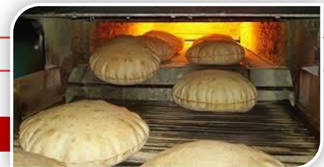
منظومة الخبز المدعم

كما حصل المواطنون على سلع غذائية مجانية بقيمة 6 مليارات جنيه سنوياً مقابل توفيرهم في استهلاك الخبز، وهو ما يعد زيادة في دعم الأسرة المصرية، حيث يبلغ متوسط دخل البطاقة 60 جنيهاً شهرياً سلعاً مجانية، ووفرت المنظومة أكثر من 50 ألف فرصة عمل جديدة بالمخازن البلدية نتيجة حركة التشغيل طوال النهار، حيث أصبح الحصول على الدقيق بدون حصص حسب الاحتياجات التشغيلية.