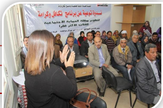
برنامج تكافل وكرامة

يجري تنفيذ نظام للتأمين الصحي على الفلاحين، وستنشأ بوزارة الزراعة إدارة للتأمين الصحي على الفلاحين وعمال الزراعة لتنفيذ