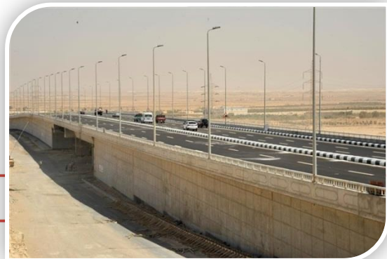
افتتاح كوبرى نوحه العلوي بمشروع