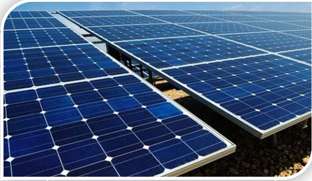
مبادرة الإنارة بالطاقة الشمسية بالقرية الذكية

مبادرة الإنارة على ثلاثة محاور، هي إنارة المباني الحكومية، والإعلانات بالطاقة الشمسية، وإنارة الطرق الرئيسية والفرعية والشوارع بجميع المحافظات بكشافات الصوديوم الموفرة عالية الضغط.