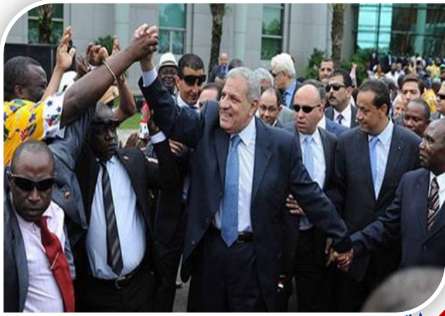
السيد السيسي والسوداني

تم تكثيف الجهود في إطار ثروة 30 يونيو لاستعادة التوازن في علاقات مصر الدولية وذلك على النحو التالي: