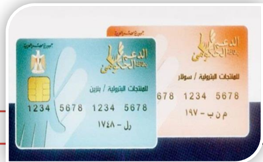
كارت البترولين الذكي

– كما سيتم بدء تشغيل المنظومة الإلكترونية لتوزيع المنتجات البترولية باستخدام كارت المستهلك أو كارت محطة تموين الوقود، بالسعر المحدد ولأي كمية يطلبها المستهلك، على أن يتم العمل بالقرار وبدء التشغيل التجريبي اعتباراً من 2015/6/15.