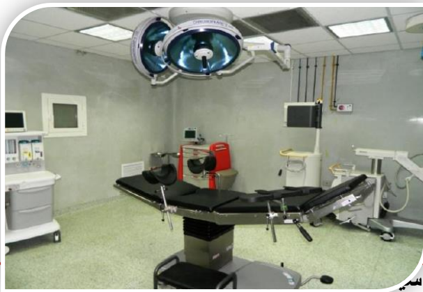
تطوير المستشفيات الحكومية

تضمنت خطة وزارة الصحة تنفيذ حزمة من مشروعات التطوير والإنشاء ورفع الكفاءة لعدد 50 مستشفى بمختلف أنحاء الجمهورية، حيث تم الانتهاء من رفع كفاءة وتطوير وإنشاء 35 مستشفى على مستوى الجمهورية، كما تم افتتاح وتشغيل 7 مستشفيات ومراكز وأقسام طوارئ في الدقهلية والجيزة وقنا والقاهرة والوادي الجديد، وهناك 6 مستشفيات تم الانتهاء منها في محافظات مرسى مطروح والجيزة والقاهرة وشمال سيناء والغربية والوادي الجديد.