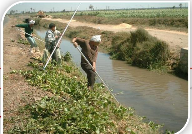
نزع الحشائش وتطهير الترغ الجديدة

وتم الانتهاء من إنشاء محطة طلبات العياط، ومحطة طلبات الثورة (1) الجديدة، فضلاً عن ثلاث محطات فرع 3 بتوشكي، وعملية كهربة المحطة العائمة بأبو سمبل، كما تجرى عملية إحلال المهمات الميكانيكية والكهربائية لمحطتى طلبات مريوط (2 ، 3)، كما تجرى عملية إنشاء محطة طلبات فارسكور الجديدة بتمويل من قرض صندوق الأوبك للتنمية بقيمة تقديرية حوالي 70 مليون جنيه مصري و5 ملايين يورو.