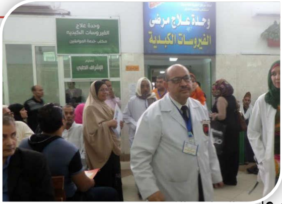
المشروعات والبرامج العمومية

تمكنت الهيئة العامة للتأمين الصحي من صرف عقار السوفالدي لعلاج مرضى التهاب الكبد الوبائي سي لنحو 16 ألف مريض، وتوسعت في افتتاح وحدات للقسطرة وزراعة الكلى وزيادة عدد الأسرة المتاحة بمستشفيات الهيئة.