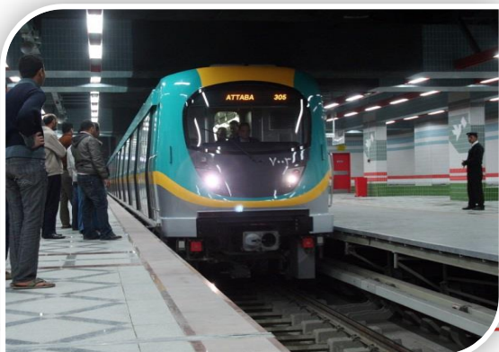
الخط الثالث لمترو الأنفاق

تم التعاون مع إحدى الشركات الصينية لتنفيذ مشروع إنشاء خط القطار فائق السرعة (المرحلة الأولى) في المسافة من الإسكندرية إلى القاهرة بطول 220 كم.