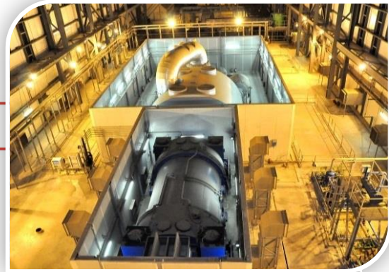
محطة توليد كهرباء بنها

- مشروع محطة توليد كهرباء بنها- دورة مركبة قدرة 750 ميغا وات، وبتكلفة استثمارية 3.3 مليار جنيه، وتم التشغيل التجاري في ديسمبر 2014.