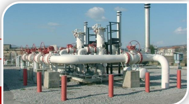
مشروعات توصيل الغاز الطبيعي

تم تنفيذ 8 مشروعات بإجمالي استثمارات 1.4 مليار جنيه تقريباً، ومنها: خط النوبارية/ السادات والذي تم تشغيله في سبتمبر 2014، وخط تعديدية محطة كهرباء بنها والذي تم تشغيله في مارس 2014، وخط غاز إدكو/ المعدية والذي تم تشغيله في مارس 2014، وخط تغذية مصنع سكر إدفو والذي تم تشغيله في سبتمبر 2014، وخط النوبارية - ميت نما، وقد تم تشغيل المرحلة الأولى بطول 67 كم في فبراير 2015.