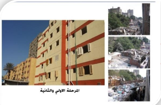
المرحلة الأولى والثانية

وتمت إزالة العشوائيات الخطيرة بمنشية ناصر، وتم نقل عدد من الأسر ساكني هذه