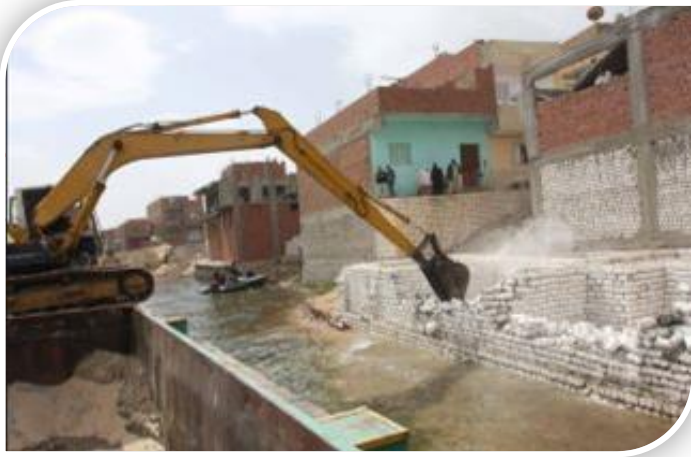
إزالة التعديت على نهر النيل

النيل وفروعه حتى لا يتم إلقاء مخلفات الصرف الصحي فيها، وإزالة معوقات التنفيذ، ومنع المواطنين والجهات الأخرى من نقل المواد السامة والخطرة باستخدام وسائل النقل النهري واستخدام البدائل الأخرى مثل السكة الحديد والطرق، والتنسيق مع وزارة البيئة لمراقبتها ومتابعة المصانع والشركات التي تلقي مخلفاتها على النهر بدون معالجة، كما تم تدشين الحملة القومية لإنقاذ نهر النيل بحضور ورعاية السيد المهندس/ إبراهيم محلب رئيس مجلس الوزراء في 2015/1/5، وبلغ عدد المخالفات المحررة منذ بدء الحملة 3.5 ألف مخالفة، كما بلغ عدد الإزالات منذ بدء الحملة 3.3 ألف مخالفة، وتم إنشاء الخط الساخن (15116) للرد على كافة شكاوى المواطنين الخاصة بالتعديت على نهر النيل والمجاري المائية.