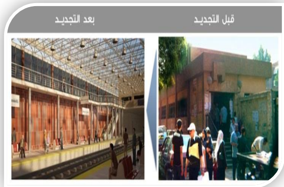
تطوير محطة حدائق المعادي