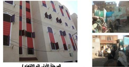
المرحلة الأولى (تم الانتهاء)

وفي المنيا تم الانتهاء من تنفيذ المرحلة الأولى، والبدء في المرحلة الثانية من مشروع تطوير منطقة عشش محفوظ، وتم الانتهاء من تنفيذ وتسكين المرحلة الأولى، وتم الانتهاء من التفاوض بنسبة 93% مع سكان المرحلة الثانية، وتم إعداد رصد الاحتياجات المجتمعية، وإجراء حصر شامل بالوظائف المطلوبة بالمصانع والورش المحيطة بالمنطقة ومقابلة المسؤولين بها.